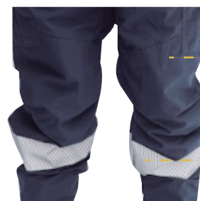
Rodillas con pinzas: dan movimiento natural a la pierna

Cinta reflectiva: mejor visualización en día y noche