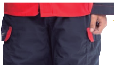
Cintura elastizada con 7 pasa cintos

El mejor calce de cintura en cualquier talla