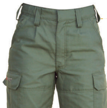
Cintura elastizada con 7 pasa cintos

El mejor calce de cintura en cualquier talla