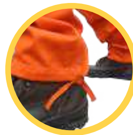
Botamangas con sistema de ajuste sobre el calzado