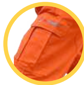
Bolsillo lateral con fuelle