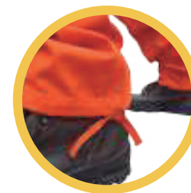
Botamangas con sistema de ajuste sobre el calzado