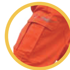
Bolsillo lateral con fuelle