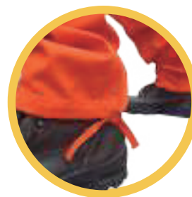
Botamangas con sistema de ajuste sobre el calzado

QR: Usa tu cámara o lector de códigos de barra y descarga la versión digital en PDF.