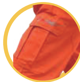
Bolsillo lateral con fuelle