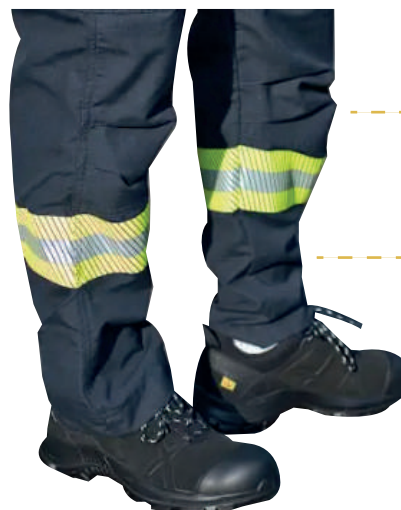
Cinta reflectiva: mejor visualización en día y noche