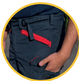
Dos bolsillos laterales