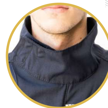
Cuello volcable tipo MAO