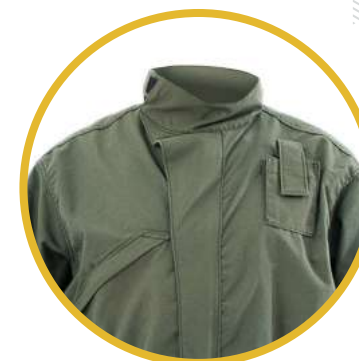
Cuello volcable tipo MAO