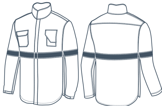
Opción cuello levantado o cerrado