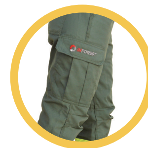
Bolso lateral com fole