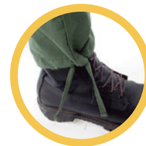
Mangas com sistema de ajuste sobre calçados