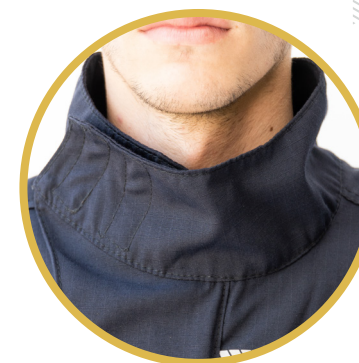
Cuello volcable tipo MAO